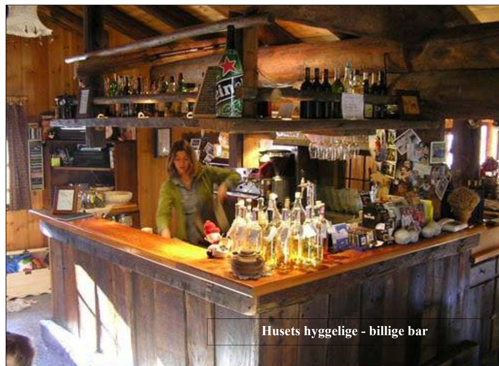
Husets hyggelige - billige bar