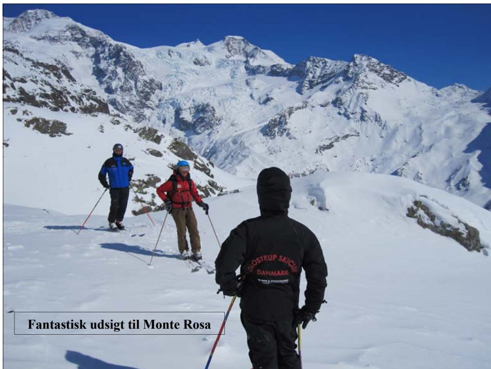
Fantastisk udsigt til Monte Rosa